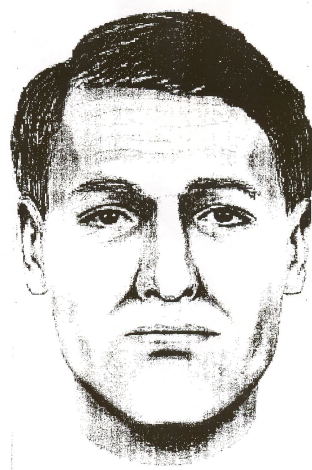
Rekonstrukcja przypuszczalnego wyglądu twarzy nn mężczyzny

zwłoki nn mężczyzny , którego tożsamości do chwili obecnej nie ustalono.